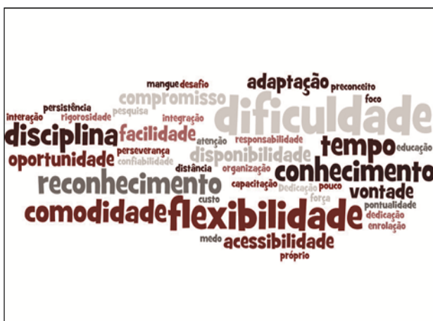
Figura 2. Três primeiras palavras que vinham à mente dos estudantes EaD quando pensavam em ensino a distância

e um futuro reconhecimento profissional. Esse dado corrobora com Santana (2013), quando afirma que o aluno EaD tem um diferencial em relação ao aluno da modalidade presencial, pois possui um tempo flexível para estar em contato com o mercado e a disponibilidade para participar de programas de estágios, bolsas e treinamentos ( trainee ).