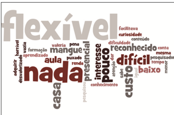
Figura 1. Visão dos estudantes sobre a EaD antes de serem ingressos nessa modalidade

Quanto à dimensão da visão que os alunos têm acerca da sua modalidade, quando questionados sobre suas percepções antes de ingressarem, muitos se limitaram a responder “nada”, “pouco” ou que sabiam que o ensino era “flexível” e “reconhecido pelo MEC”, como visto na Figura 1, gerada através da ferramenta Wordle .