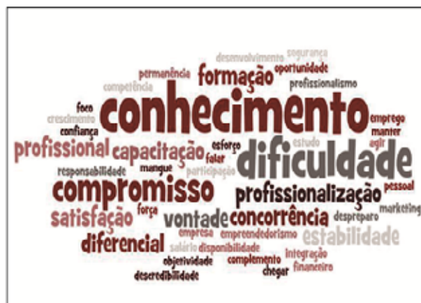
Figura 3. Três primeiras palavras que vinham à mente dos estudantes EaD quando pensavam em empregabilidade

Já no que diz respeito à dimensão que trata da compreensão do aluno EaD acerca do conceito de empregabilidade, as palavras mais recorrentes, como pode ser visto na Figura 3, foram “conhecimento”, “dificuldade”, “compromisso”, “profissionalização”, “formação” e “concorrência”. Com isso, percebe-se que para esses alunos o conhecimento, que foi a palavra mais recorrente dentre todas, é o ponto de partida para manter-se empregado, considerando que a empregabilidade se refere a uma fase de preparo do indivíduo para o ingresso e permanência no mercado de trabalho, assim como a junção das competências e das variáveis psicológicas necessárias (CAMPOS, 2011).