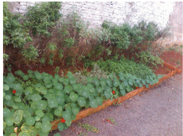
Figura 4 Capuchinha aos 10 meses.

O maior rendimento foi observado na capuchinha, que atingiu o melhor aspecto paisagístico quanto ao seu porte e beleza. Das 20 mudas plantadas apenas uma sobreviveu, e se alastrou por todo o canteiro entre janeiro e fevereiro. O responsável foi uma lagarta, que foi eliminada manualmente sem necessidade de uso de agrotóxicos, e a mesma não voltou a atacar. A capuchinha foi a planta com maior beleza e impacto paisagístico: suas folhas redondas e grandes e sua flor com cores fortes exaltaram essa qualidade (Figura 4). Com exceção da hortelã, as outras espécies tiveram seu desempenho conforme o esperado (CASTRO; CHEMALE, 1995; FURLAN, 1999).