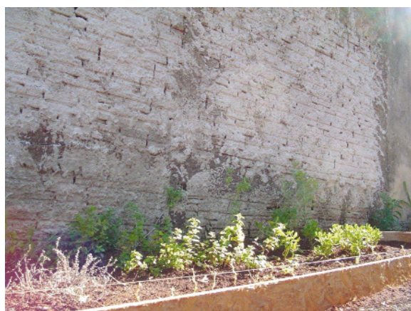
Figura 1 Canteiro após duas semanas.

Após o preparo do solo, o canteiro foi irrigado por aspersão duas vezes ao dia (no início da manhã e no fim da tarde) durante sete dias. Em seguida, foi feito o plantio das mudas das seguintes espécies medicinais: babosa ( Aloe vera L.), bálsamo ( Cotyledon orbiculata L.), capuchinha ( Tropaeolum majus L.), hortelã ( Mentha piperita L.), losna ( Artemisia absinthium L.), manjeriço ( Ocimum basilicum L.), mil-folhas ( Achillea millefolium L.) e orégano ( Origanum vulgare L.) (Figura 1).