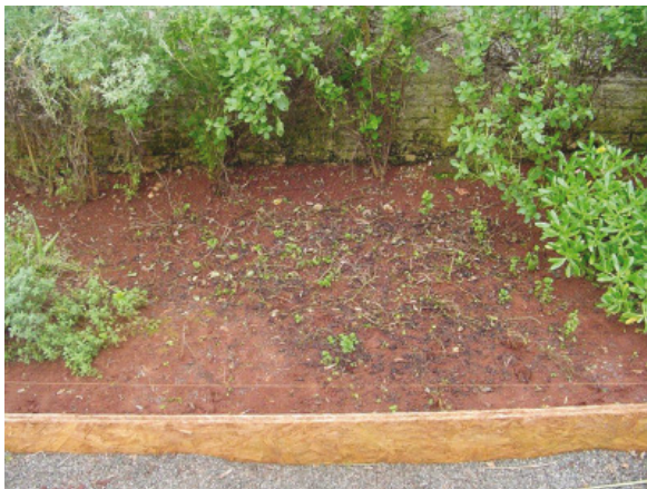
Figura 3 Canteiro aos 10 meses (redução da hortelã).

A sobrevivência e desenvolvimento das mudas foram diferentes conforme a espécie, porém somente a hortelã não teve crescimento contínuo. No início do plantio a hortelã apresentou desenvolvimento limitado, com poucas folhas e nenhuma flor. Após o período de um mês já apresentava resultados, aumento da folhagem e espalhamento pelo canteiro. No período de frio e principalmente com a chuva de granizo, suas folhas foram queimadas e caíram perdendo o aspecto belo e limpo (Figura 3).