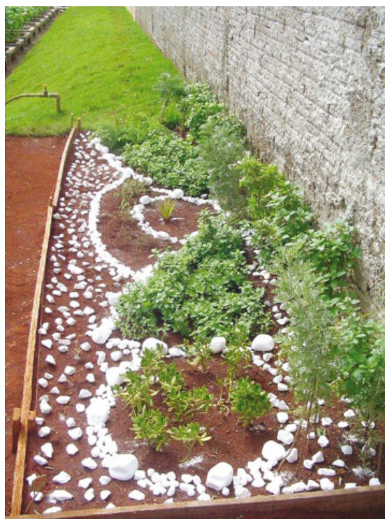
Figura 2 Canteiro após 2 meses.

Houve a preocupação de utilizar espécies, como a losna e o manjeriço, para proporcionar o efeito estético através de elementos paisagísticos; uso de arbustos, quebrando a horizontalidade e trabalhando com massas e elementos vegetais. Juntamente com os arbustos de pequeno porte, o uso da forração foi garantido com plantas rasteiras, capuchinha, hortelã e orégano, buscando harmonia, uniformidade e diferenciação paisagística em termos de composição (Figura 2).