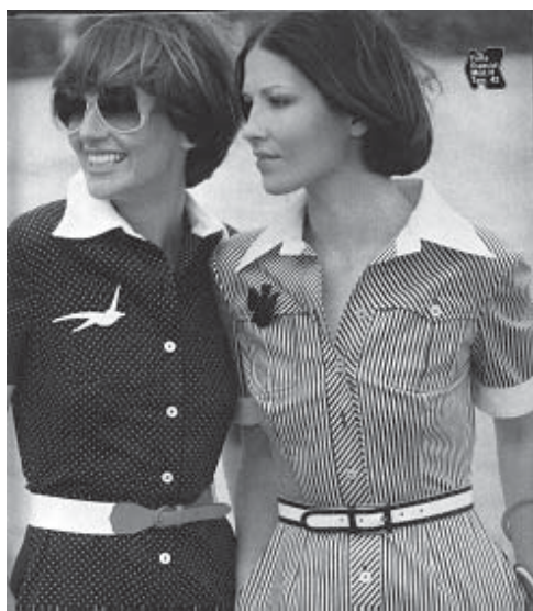
Revista “Manequim”, abril, 1977, p.25.

O rufo influencia a moda nas golas pierrô, quando aparece em modelos na revista da edição de abril, 1978. Foi como uma forma inconsciente das mulheres demonstrarem o seu poder almejado. Segundo Laver, o rufo é um exemplo do elemento ‘hierárquico’ nas roupas. As mulheres também o usavam, mas no traje feminino há sempre outro elemento a ser notado. O ‘princípio da sedução’, como foi chamado, é uma tentativa de explorar os encantos femininos de quem usa a roupa, como, por exemplo, o decote. As mulheres desejavam usar um rufo para mostrar o seu status na sociedade: queriam também ser atraentes como mulheres.” E muitas outras golas vieram juntamente com a pierrô, a “collorete”, gola embabada A maneira dos pierrôs, a gravatinha, acessório eleito do ano e a gola laço.