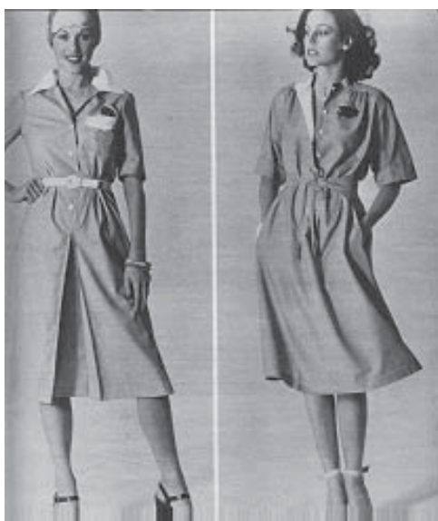
Revista “Manequim”, maio,1976, p.41.

vestido de alças; o “chemisier” de seda; o chemisier trancado a zíper; o chemisier com abotoamento na frente e muitos bolsos, o “chemisier” entre todos, o preferido. Suas formas longas ou justinhas, mais parecem um minivestido e, em camisão, para ser usado cortado com o algodão e usar com “jeans”, com um cinto embutido em forma de túnica, e de mangas curtas no simples “chemisier”. Enfim, a vida do eterno, clássico chemisier de poás, de listrinhas de algodão, avivados pelos acessórios, iluminados pela gola e punhos de fustão imaculadamente branco, o “chemisier” é um vestido especial, podendo ser feito tanto em seda, crepe, como brim e “jeans”. Sabemos que o “chemisier” tornou-se a roupa básica, em qualquer momento, em qualquer clima. Muda-se o tecido do mais precioso ao mais simples, mas mantém-se inalterada a elegância, a praticidade, a versatilidade desse modelo único, consagrado eterno trunfo.