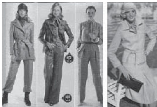
Revista “Manequim”, junho, 1978,p.33 e 48.

Permaneceu como peça símbolo da moda verão 79/80, revista “Manequim”, agosto, 1979.