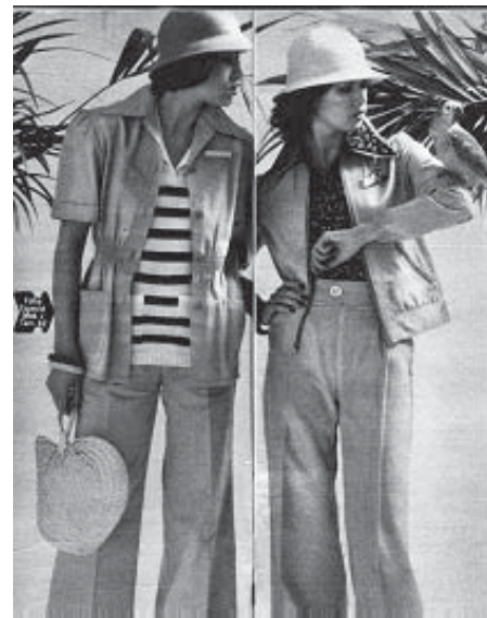
Revista Manequim, fevereiro de 1975, p.22,23.

A praticidade desejada também é abordada através de roupas outrora associadas aos dias festivos e noites de gala, como é o caso do vestido longo, agora também apropriado para o período diurno. Portanto, não havia mais a idéia de que os vestidos longos eram somente para uma grande festa e feitos de tecidos caros, nobres. A mulher executiva podia estar moderna e confortável com um longo de brim para ir a qualquer lugar.