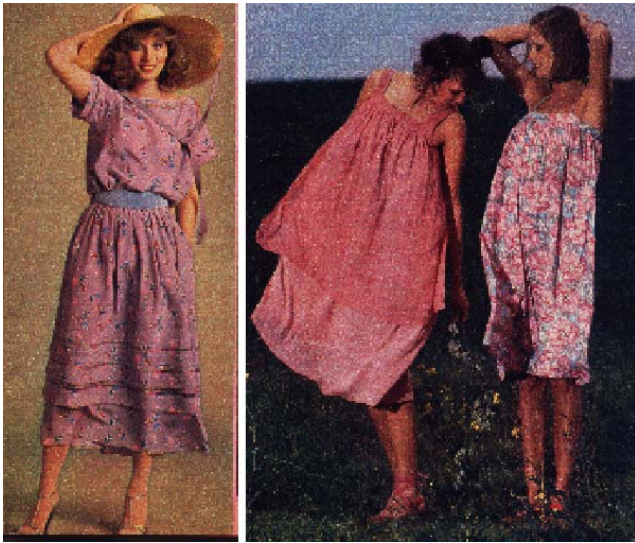
Revista Manequim, abril, 1978 e novembro, 1977.

Outra variante da chemisier era assim descrita: em estampa florida eram duas peças: saia com babados, cós abotoado e blusa de golinha rente, mangas bufantes. As vantagens de um modelo assim são muitas, justificava a revista de janeiro de 1978. Tal peça passa por vestido, quando você quer; entra na formação de novos conjuntos, é o clássico, a versatilidade e a praticidade na moda camponesa.