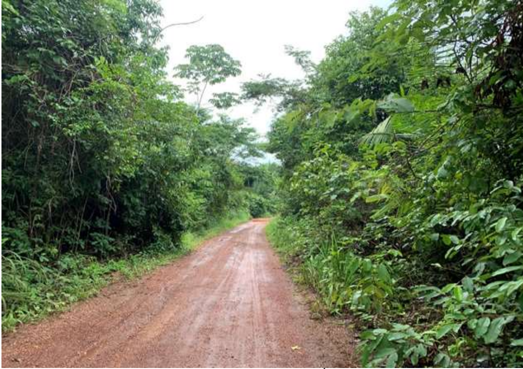
Figura 3. Estrada de acesso P. A. Água Limpa

Essa preservação, para alguns, é necessária: “Temos que ter as ervas na beira do córrego, os bichos gostam, nós também”. Outros preservam as nascentes: “Tenho um brejo que eu quero proteger, o gado bebe na nascente”. Entretanto, outros não pensam da mesma forma: “Tenho 20% de reserva legal, não derrubei porque não deu tempo, agora não posso mais por causa da fiscalização”. Outros afirmam que não havia muitas áreas com natureza intocada: “Aqui era uma fazenda, já tinha sido desmatado, quando cheguei era tudo pasto”. Uma parcela de 84,12% dos assentados identificou os solos como sendo de boa qualidade; 15,88% percebem o solo como sendo de má qualidade; porém, a prática rotineira do plantio convencional ocasiona a perda de fertilidade do solo, comprometendo o meio ambiente e futuramente até mesmo a produção.