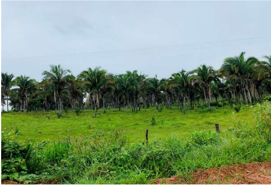
Figura 2. Paisagem de acesso ao P. A. Trecho Seco

Entende-se que a paisagem é algo criado, e não dado, sendo o resultado da materialização das relações sociais, modificadas de acordo com o tempo e a cultura, em que o modo de relação com o ambiente tece as paisagens (BERQUE, 1994). Quanto à contribuição com a paisagem, em geral os assentados demonstram pouco cuidado com o aspecto paisagístico e muito mais com o aproveitamento dos espaços para a produção. Observa-se um menor grau de percepção no tocante à paisagem rural. Ou seja, não foi percebida uma preocupação com o aspecto estético, somente com a produção. Todos mencionaram a ação antrópica, justificando que o desmatamento foi necessário para que as famílias pudessem produzir. Outros afirmaram que, quando ocuparam o espaço, já havia ocorrido o desmatamento: “Aqui era tudo mata, mudou muito”. Em alguns dos lotes de produção dos assentados, há áreas de reserva legal (áreas sem cultivo, que preservam a biodiversidade e a beleza da paisagem de natureza intocável), o que é uma riqueza inestimável.