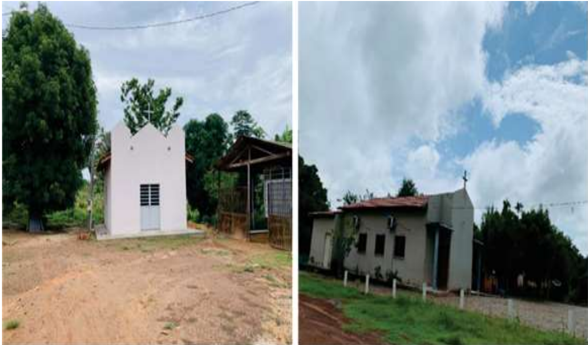
Figura 1. Igreja no P. A. Ouro Verde e no P. A. Atanásio

sociabilidade, foram citadas as igrejas, sendo que 33,30% dos assentados frequentam algum templo religioso dentro do assentamento (Figura 1).