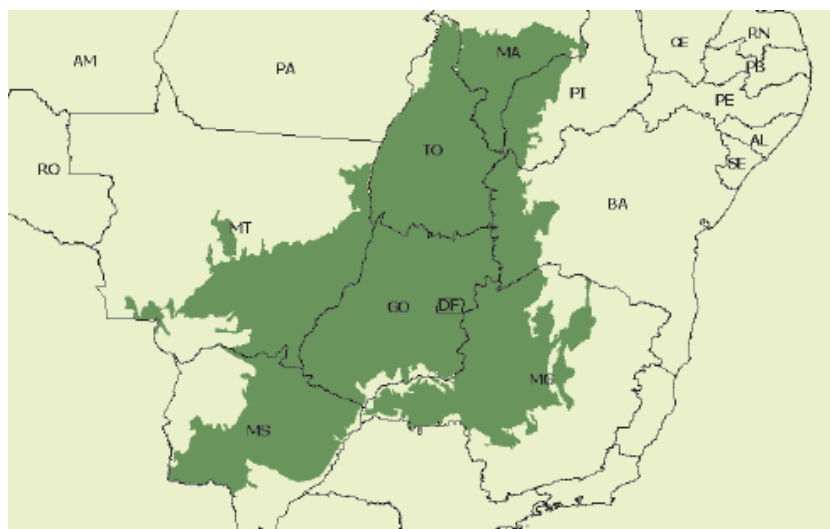
Figura 1 Área central do Cerrado no Brasil. Adaptado de IBGE (1993).

Fonte: Anuário Estatístico de Goiás (2003).