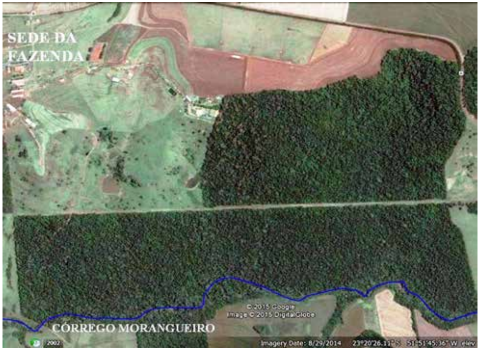
Figura 2. Vista geral da área de estudo, remanescente florestal da Fazenda Escola do UNICESUMAR. Maringá, Paraná.