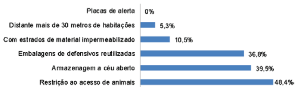
Figura 2. Porcentagem de propriedades que atendem às exigências da NR-31 quanto à armazenagem dos agrotóxicos

Conforme os dados apresentados na Figura 2, nenhuma das propriedades visitadas apresentava placas de alerta. A justificativa dada para este fato foi que isso aumentaria o risco de roubo dos produtos, pois com estas placas, em evidência, ficaria mais fácil identificar o local onde estão armazenados os agrotóxicos. Outro requisito que é pouco atendido pelos agricultores entrevistados é a distância de 30 m da localização do armazém dos produtos em relação às habitações. Apenas 5,26% dos produtores atendiam esse item. O argumento apresentado para o não atendimento desta exigência foi o mesmo utilizado para a não instalação das placas, que a localização distante da casa facilita a ação de ladrões. Sendo assim, a maior parte dos agricultores guarda os defensivos nos porões das casas ou em garagens bem próximas as residências acreditando que os produtos estarão mais seguros.