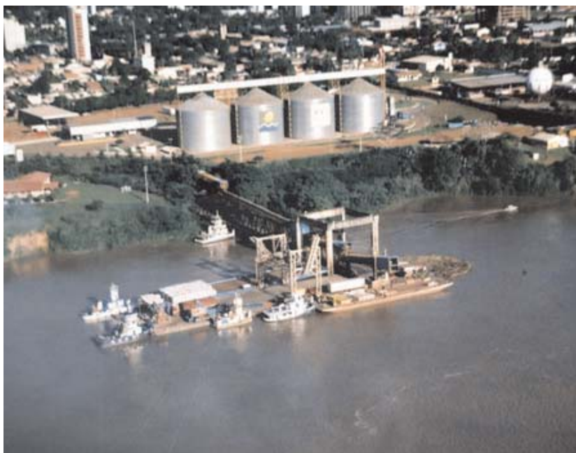
Figura 2. Porto da Cidade de Porto Velho - RO

O funcionamento do corredor de escoamento Noroeste iniciou-se em 04/1997. A partir de então a produção do Norte do Estado do Mato Grosso, que antes era escoada pelo Porto de Paranaguá (PR), conhecido como corredor Sul, passa a ser escoada por hidrovía a partir de Porto de Porto Velho (RO), conforme figura 2.