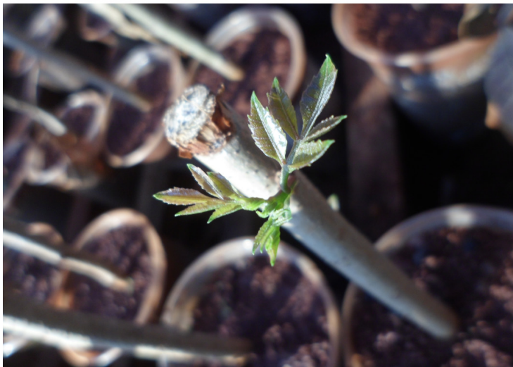
Figura 2. Apresentação visual de brotações de estacas de Schinus terebinthifolius Raddi. UFGD, Dourados (MS).

A brotação foi máxima (49,3%) aos 35 DAE e reduziu depois, atingindo 22,9% aos 56 DAE. Essa redução provavelmente deva-se às variações da temperatura (Figura 1) durante o estudo, alcançando a mínima de 11,1 °C, o que pode ter causado estresse térmico e, conseqüentemente, a morte das estacas que ainda não haviam