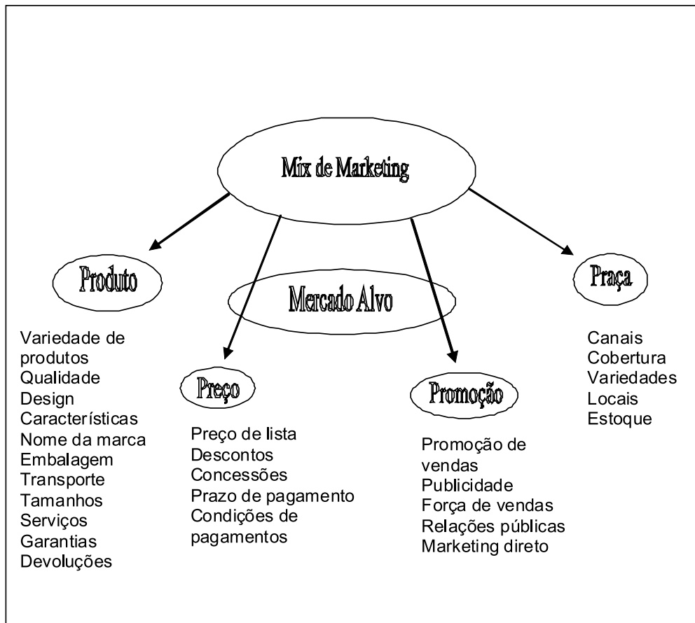
Figura 2 Variáveis componentes do marketing mix (KOTLER, 2008).

A empresa Ypê lançou uma parceria com a Fundação SOS Mata Atlântica para reflorestamento, que conquistou o prêmio de preservação do meio ambiente ( Top of Mind ). Dessa forma a empresa passa a conquistar consumidores que desejam produtos adequados ambientalmente. O mesmo ocorre com a Natura: empresa do setor de cosméticos, tem estimulado seus consumidores a adquirirem produtos com embalagens recicladas e refil para reposição – mostrou estar bem posicionada, pelo mesmo prêmio. A Natura demonstra em suas ações, nos catálogos que desenvolve, palestras e cursos as regiões de onde são retirados os materiais necessários, incentivando a consciência ecológica.