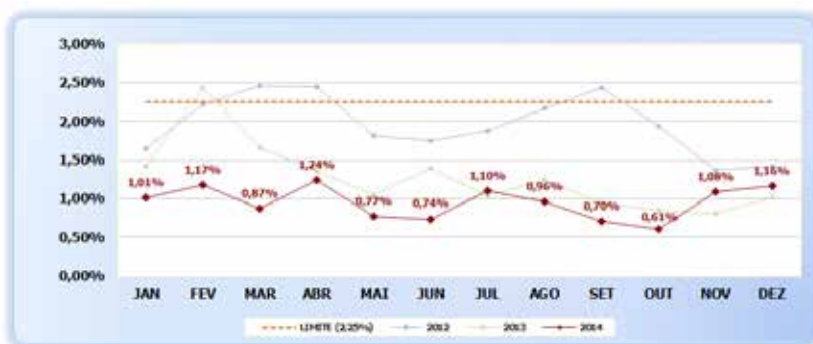
Gráfico 2. Inadimplência de Clientes Até 90 dias

O indicador de inadimplência (Gráfico 2) permite avaliar a melhoria efetiva do processo de cobrança e do relacionamento dos clientes com a ECT, uma vez que é possível correlacionar inversamente esse indicador à qualidade do relacionamento do cliente com a empresa (quanto menor a inadimplência mais forte, sustentável e promissor é o relacionamento).