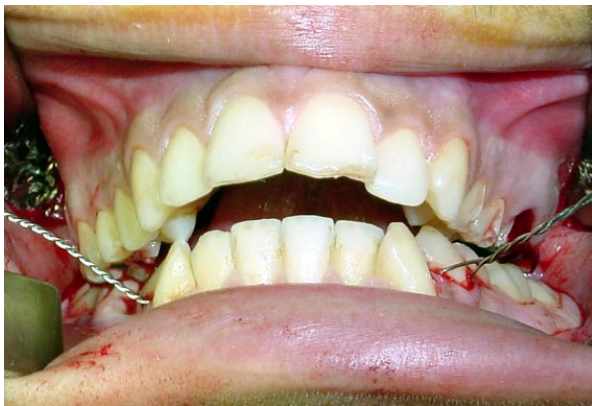
Figura 2: Aspecto oclusal

Foi operado no dia 13 de setembro de 2008, sob anestesia geral balanceada, quando foi realizado acesso intraoral em fundo de vestibulo para redução e fixação de fratura de corpo de mandíbula (figura 3).