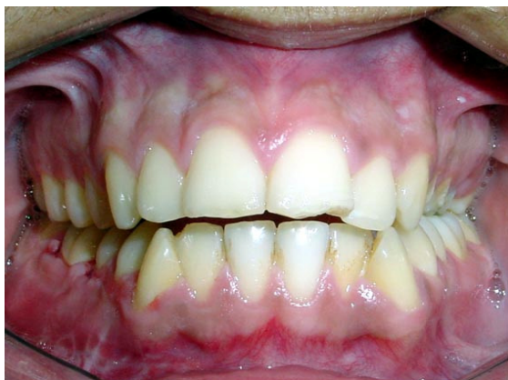
Figura 7: Oclusão final