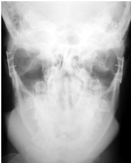
Figura 6: Rx Towne mostrando as reduções e fixações das fraturas

apresentava-se com oclusão dentária satisfatória (figura 7) e desvio mandibular na abertura bucal (figura 8), porém, sem comprometimento de suas funções mandibulares normais.