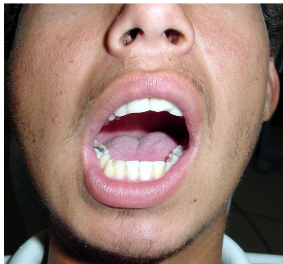
Figura 8: Desvio mandibular na abertura