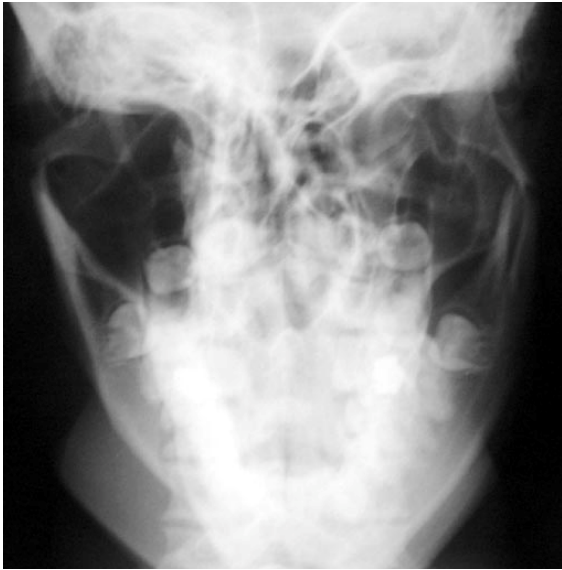
Figura 1: Rx Towne mostrando as fraturas

fratura em corpo de mandíbula direita e fratura subcondilar baixa bilateral com deslocamento para medial (observado na radiografia denominada Towne – figura 1). Ao exame clínico foi possível observar a alteração da oclusão, conforme visto na figura 2.